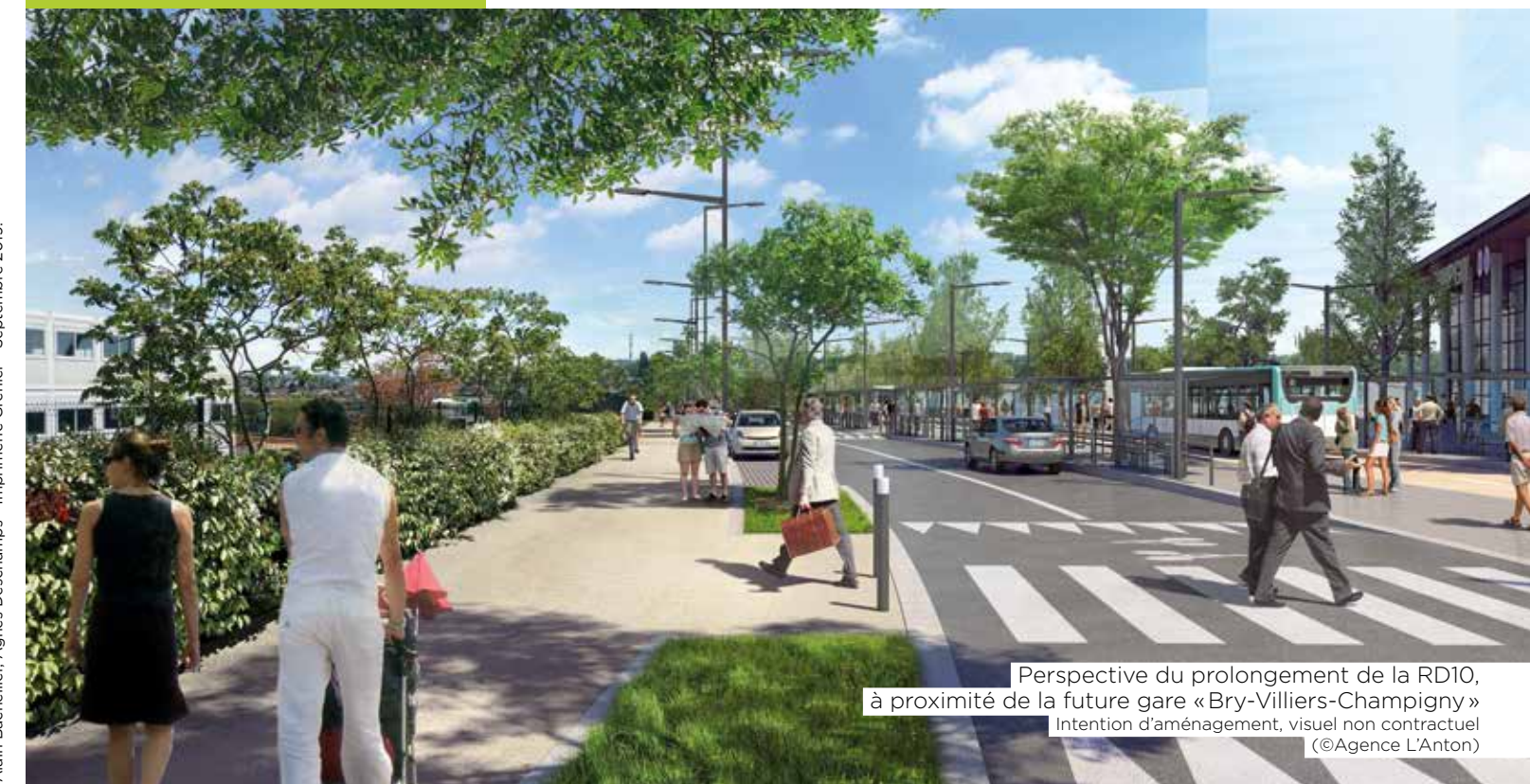
Perspective du prolongement de la RD10, à proximité de la future gare « Bry-Villiers-Champigny » Intention d'aménagement, visuel non contractuel