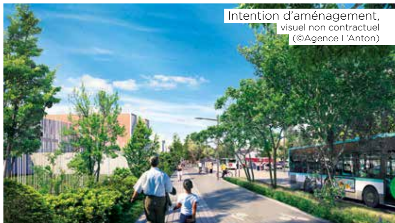
Intention d'aménagement, visuel non contractuel